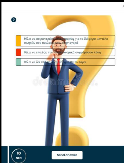
Στιγμιότυπο οθόνης από δραστηριότητες στην πλατφόρμα DiBL

Η εναρκτήρια ημερομηνία των επιμορφώσεων ήταν 20η του Φλεβάρη και έως και το τέλος του Μάρτη ολοκληρώθηκαν οι επιμορφωτικές δράσεις όλων των ομάδων-συμμετεχόντων. Η διάρκεια της επιμόρφωσης ήταν πέντε ημέρες κατά τις οποίες οι εκπαιδευτικοί απουσίαζαν δικαιολογημένα από τα διδακτικά τους καθήκοντα. Το περιεχόμενο του σεμιναρίου αφορούσε στις παιγνιώδεις δράσεις και τον ορθό τρόπο ένταξής τους στην εκπαιδευτική διαδικασία. Αναφορικά κάποια από αυτά τα εργαλεία είναι: fourcorners, fishbowldebate, answergarden, kahoot. Ιδιαίτερη βάση δόθηκε στην πλατφόρμα DiBL, η οποία αποτελεί μία νεοεταχθείσα πλατφόρμα-εργαλείο στον χώρο της εκπαίδευσης και αφορά στη δημιουργία διλήμματος-ανάπτυξη κριτικής ικανότητας των μαθητών. Η δράση αυτή έως το τέλος του τρέχοντος σχολικού έτους 2022-2023 ολοκληρώθηκε με τον σχεδιασμό-κατάθεση-υλοποίηση στην τάξη και αποτίμηση σεναρίου μαθήματος στο οποίο θα αξιοποιούνται τα προαναφερόμενα εργαλεία.